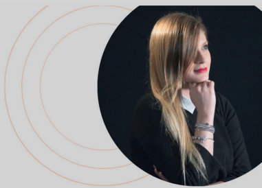
FRONT OFFICE E FORMAZIONE DOMENICA GALLI